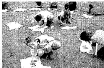
Campament de l'AEIG Sant Bernat de Claravall.

Estades. Són activitats educatives en les quals