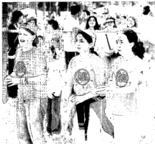
La festa de l'Esplai d'Estiu dels esplais de Catalunya. L'any 2005, al Prat de Llobregat es va celebrar la festa de la Fundació Catalana de l'Esplai.