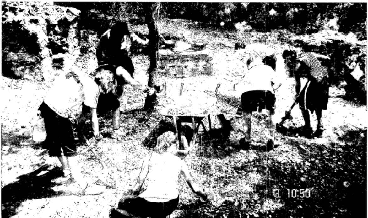
Camp de treball del castell de Sant Iscle a Vidreres (Selva), que ja fa alguns anys que funciona i ha portat joves de tot Europa a treballar a l'Arenya.

El secretari general de la Secretaria de Joventut de la Generalitat explica en aquesta entrevista les alternatives que ofereix el seu departament amb vista al lleure i l'estiu.