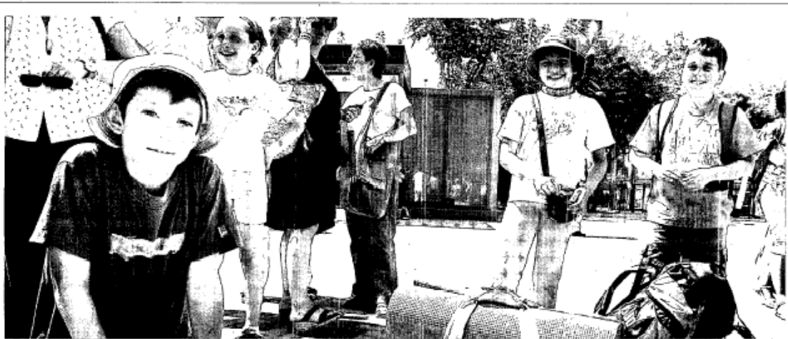
Nens que al juny del 2007 van participar a les colònies lingüístiques de la Fundació Pere Tarrés.