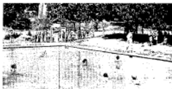
Santa Pau, casa de colònies dels Arts.

● Colònies. Els vaillets s'allotgen en cases i albergs autoritzats. Els programes combinen activitats pedagògiques i lúdiques que poden