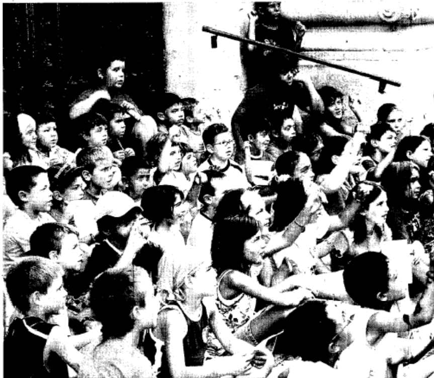
Grup Catesplai Planenc, del Pla de Santa Maria, que l'any passat va celebrar el seu vintè aniversari i va fer el tradicional casal d'estiu.

En aquest aspecte, les propostes impulsades per agrupacions com ara el Grup Catesplai Planenc del Pla de Santa Maria, que l'any 2007 va celebrar el vintè aniversari fent el tradicional casal d'estiu –es van combinar les activitats a la plaça de l'Església del poble amb unes colònies de quatre dies a la casa La Figuera de Castellnou de Bages– i va tenir com a responsables 16 monitors que van treballar de manera altruista i voluntària, o el campament per a nens i nenes de 3 a 5 anys a Castellar de Ribera que, organitzat per l'Agrupament d'Espial Riallera de Solsona, intentarà ensenyar els vaillets a dormir en una tenda de campanya, banyar-se al riu, relacionar-se amb els companys i fins i tot conèixer com influeix la Lluna sobre la Terra, no són sinó la demostració que a l'estiu es pot gaudir del lleure sense oblidar l'aposta per l'educació. I més si es té present que a les colònies o als casals