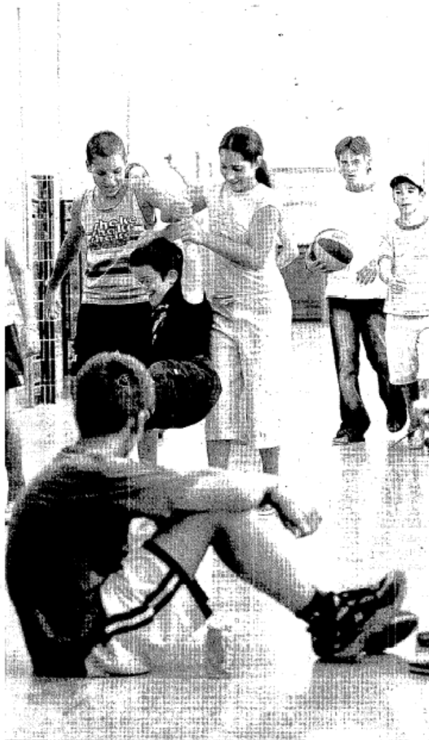
L'any 2006, a Tortosa es van muntar colònies d'estiu per a nens afectats pel TDAH.

Per als més grans, les oportunitats es multipliquen: camps de treball al nostre país o a l'estranger, estades i viatges solidaris i responsables, brigades, intercanvis internacionals... En definitiva, un ampli ventall de propostes que poden portar l'interessat des d'Arbúcies, per recuperar la història local descobrint la vaixella del castell de Montsoliu, fins a Maputo (Moçambic), per ajudar els membres de la Uniao Nacional de Camponesses, sense oblidar els treballs a Sare Coly Salle, a la Casamance oriental (Senegal), o el